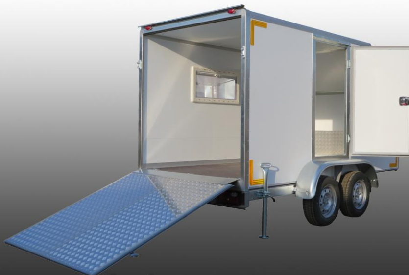
Прицеп-фургон предназначен для перевозки мототехники и отдыха.